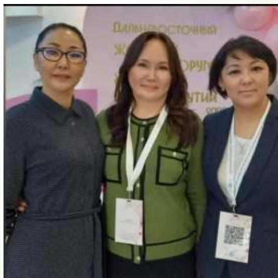
Дальневосточный женский Форум и XIV Съезд женщин Якутии.