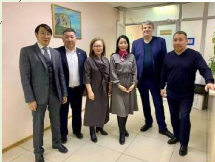
Прямой эфир НВК Саха