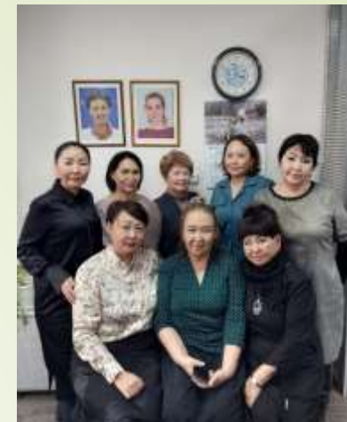
На встрече с Уполномоченной при Президенте Российской Федерации по правам ребенка Республики Саха (Якутия)